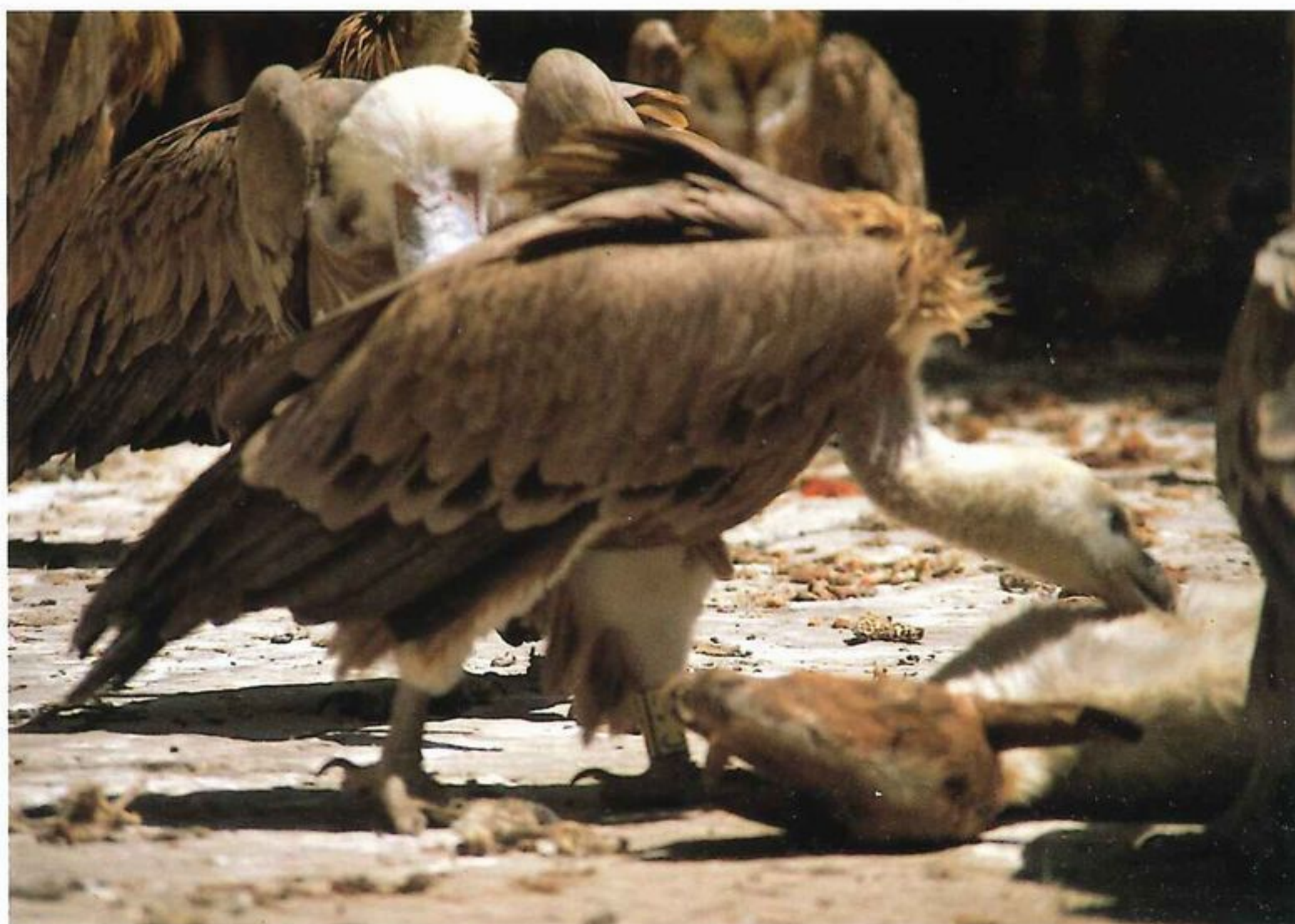
Ejemplares de Buitre Leonado en el centro de “El Boticario”.

Las razones del ingreso de los ejemplares en “El Boticario” son debidas tanto a agentes o causas naturales —agotamiento, hambruna, hipotermia tras tormentas o caídas al mar— como a factores adversos del medio tales como proliferación de tendidos eléctricos, disparos de cazadores, colocación de venenos para perros y zorros o sellado de vertederos y muladares, imputables a actuaciones humanas y que conllevan una pérdida del hábitat. En el origen, no obstante, subyace la inexperiencia de la edad, la inmensa mayoría son jóvenes del año que acaban de abandonar el nido o bien se disponen a atravesar el Estrecho de Gibraltar camino de África e incluso utilizarán determinadas sierras andaluzas como lugar de estancia hasta finales del invierno.