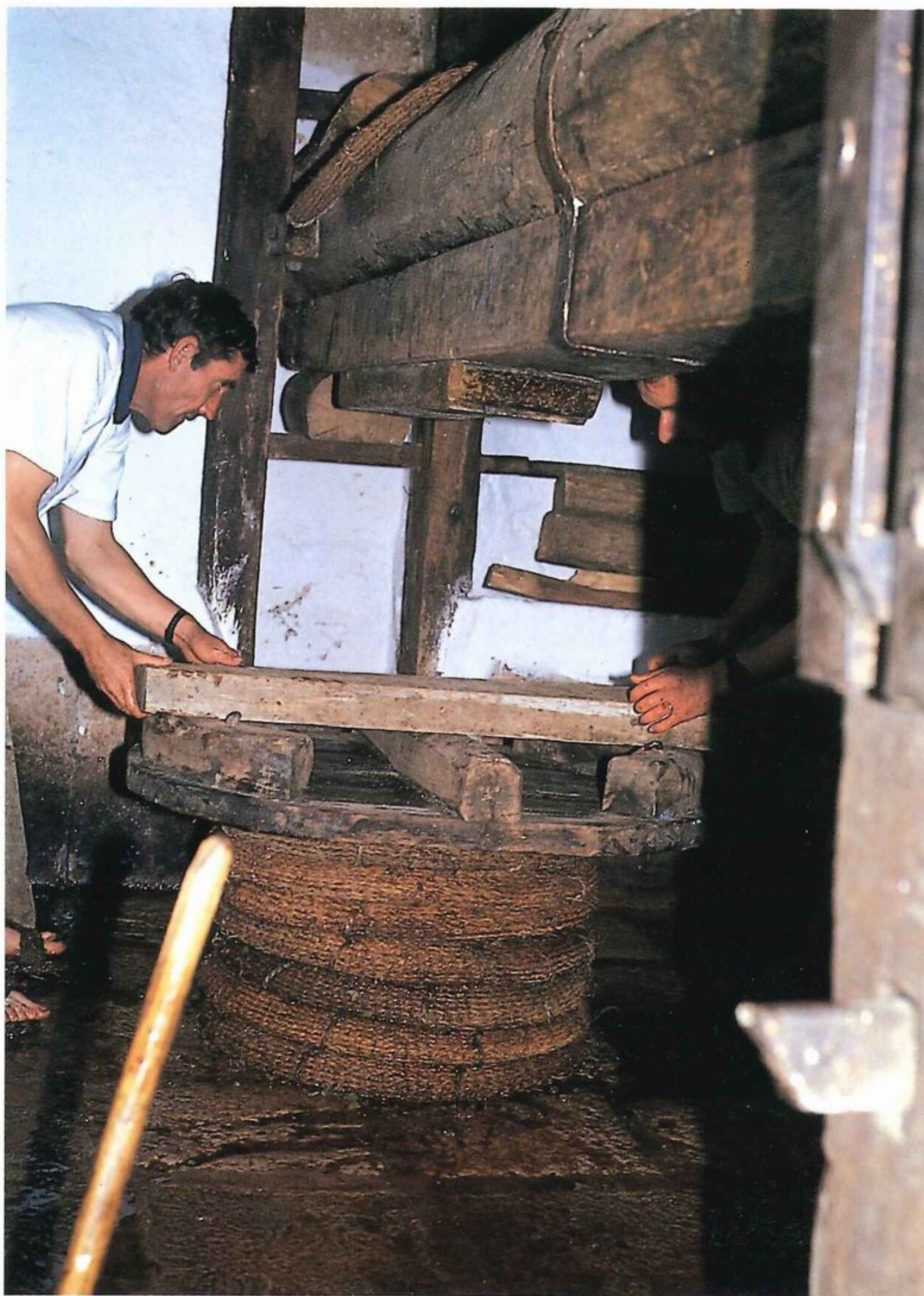
Lagar de Torrijos.

En la actualidad el Lagar de Torrijos forma parte de las instalaciones de uso público del Parque Natural de los Montes de Málaga y es escenario de la Fiesta de la Vendimia que se celebra anualmente en otoño.