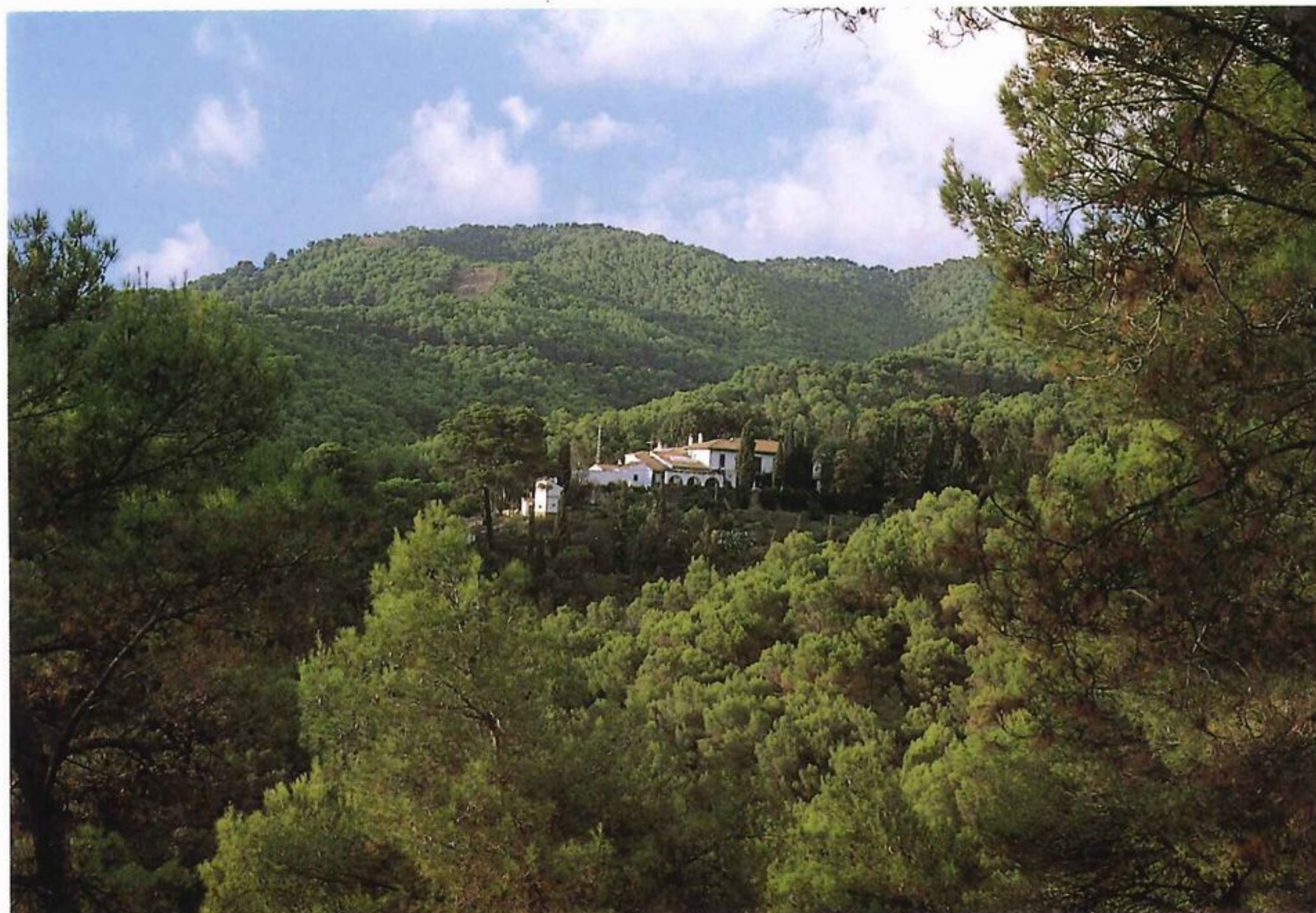
Parque Natural "Montes de Málaga". Vista de "El Boticario".

presencia del Camaleón común ( Chamaeleo chamaeleon ).