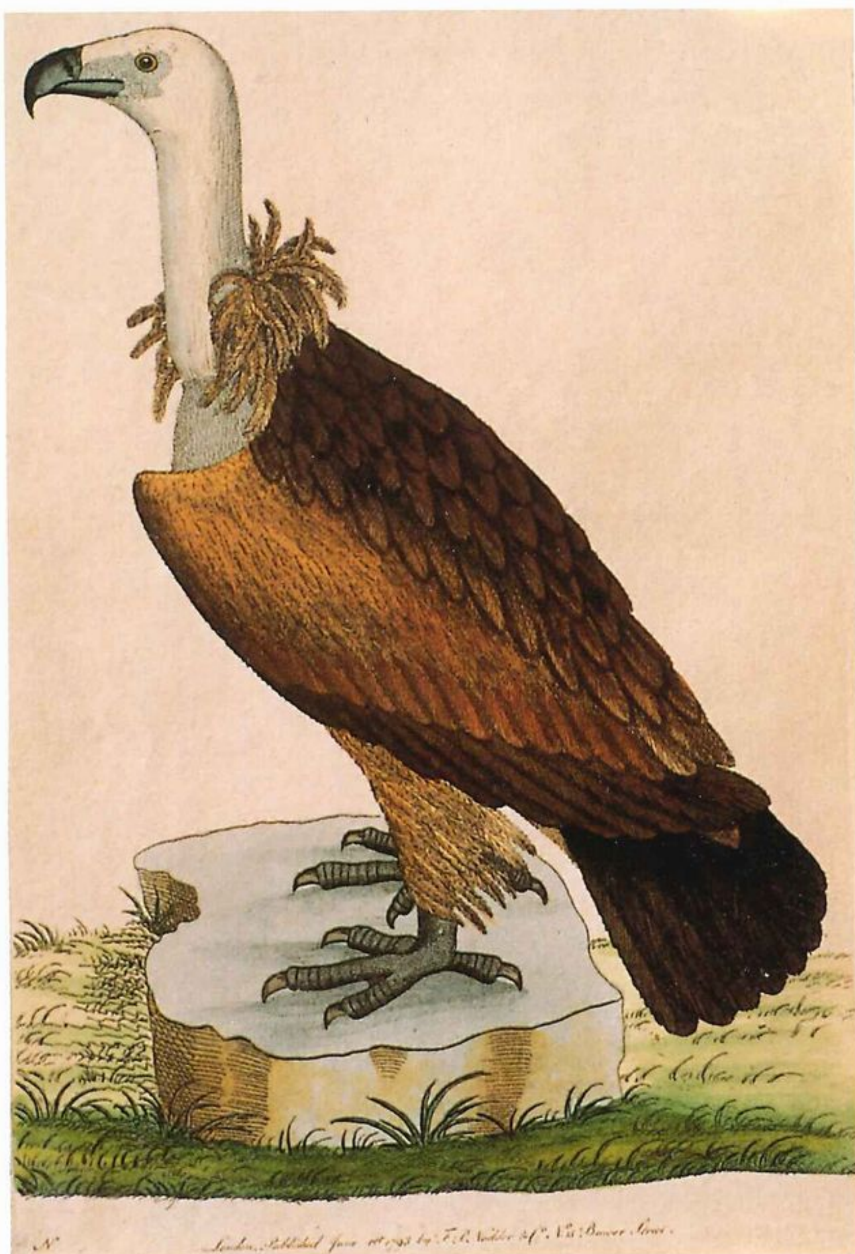
Grabado siglo XVIII. Joven buitre leonado.