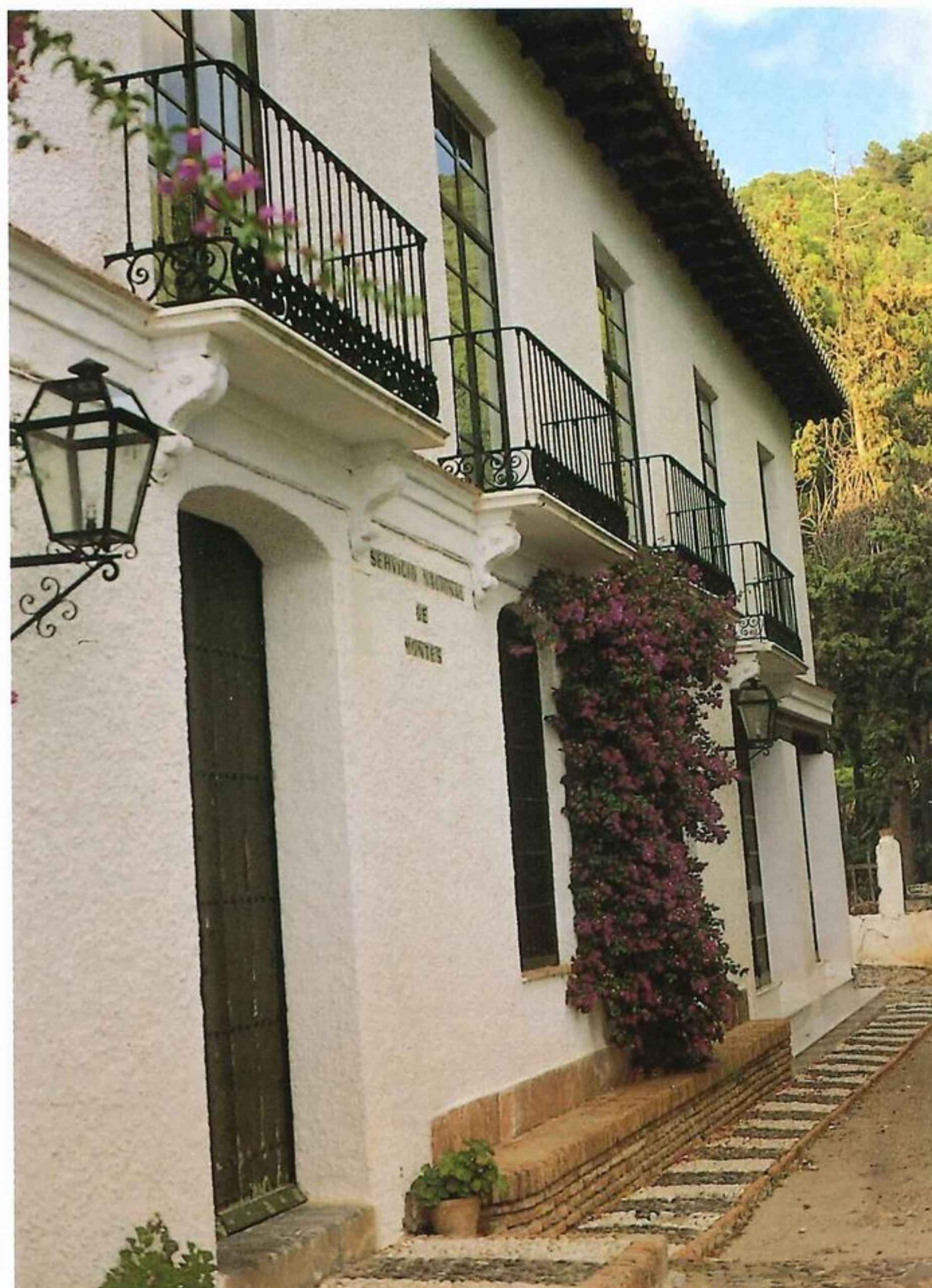
Casa forestal “El Boticario”.

referido, se le arrebató y sacada que fuera a subasta pública, se remató en el Presbítero don Pedro de Osorio y Ortega, quien acabó de repoblarla de vides y le construyó una hermosa casa.