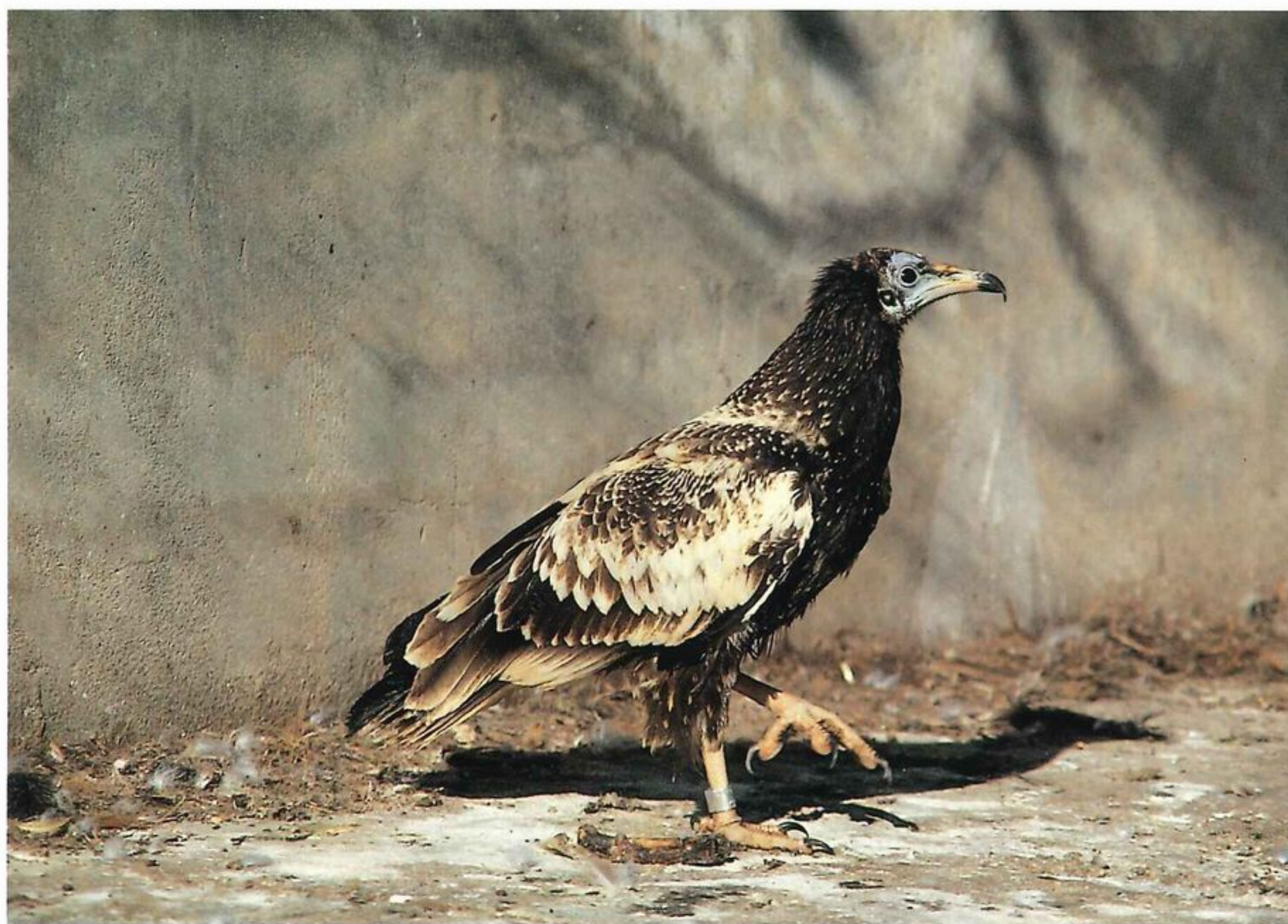
Joven de Alimoche.

para la Defensa de la Naturaleza (F.A.A.D.N.).