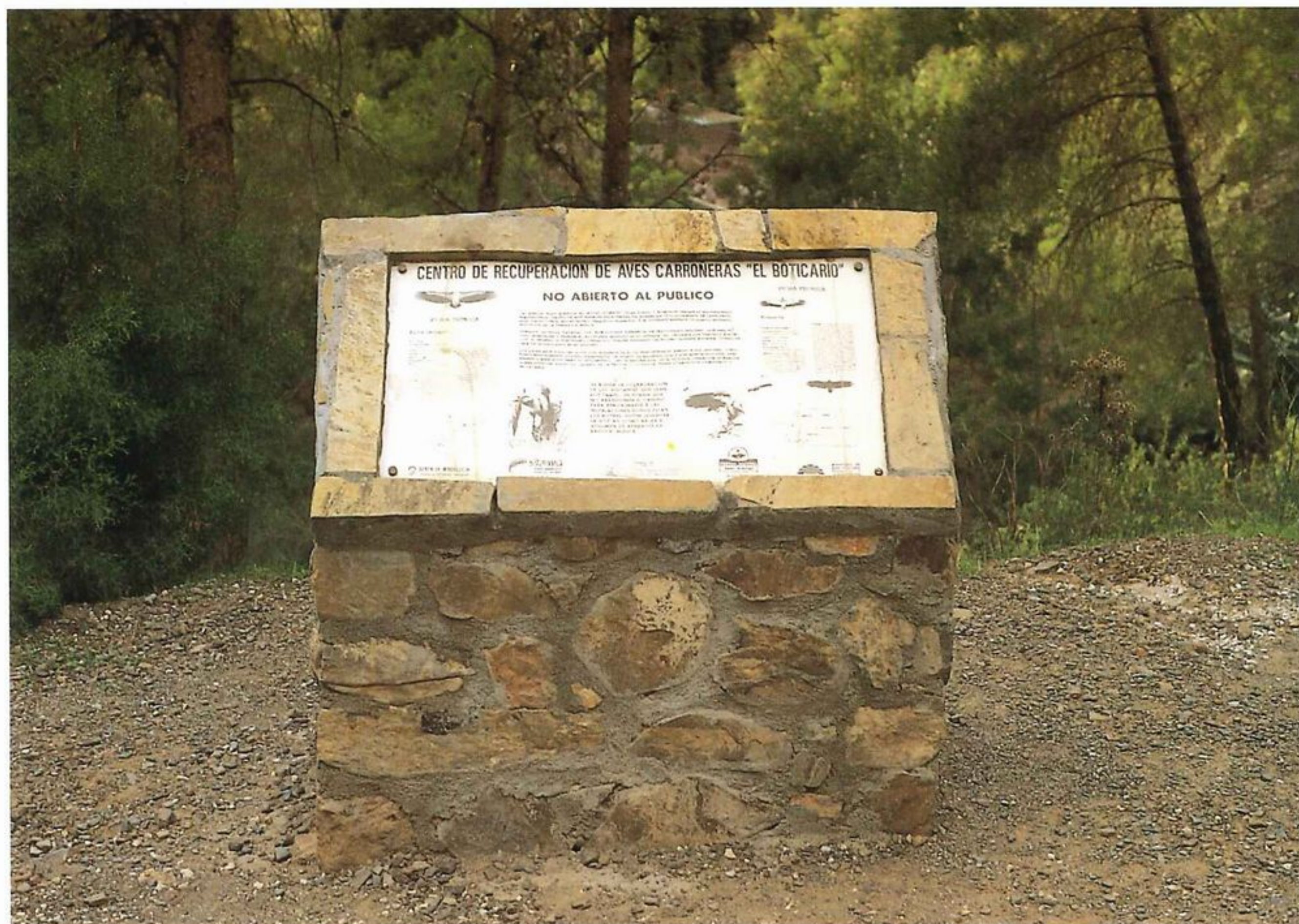
Panel informativo del Centro de Recuperación.

A partir de esta fecha, la finca conoció diversos propietarios, que la disfrutaron unos por más tiempo y otros por menos, pero siempre cuidándola con el esmero que merecía una hacienda de esta categoría, sirviendo con frecuencia como prenda hipotecaria en las múltiples ocasiones que algunos de sus sucesivos propietarios hubieron de pedir dinero prestado para proseguir sus labores.