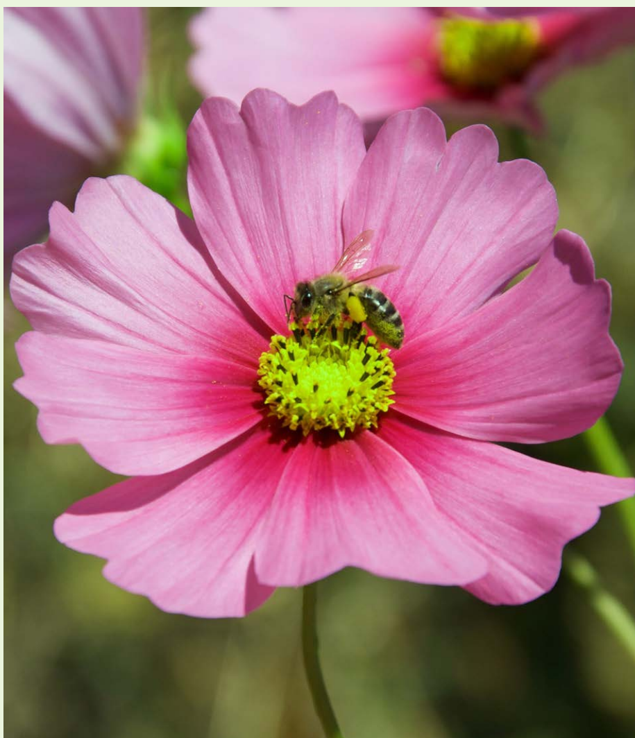
Flor de cosmos morada.

Esto beneficia los cultivos en calidad y cantidad de producción. Abejas, sírfidos, escarabajos, abejorros... todos son grandes polinizadores y muy importantes en nuestras huertas, por lo que es recomendable añadir en ellas plantas que tengan flores, combinándolas para que perduren durante todo el año.